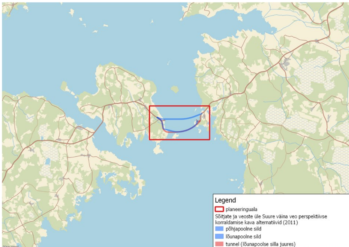
Joonis 3. Taotletava Suure väina püsiühenduse riigi eriplaneeringu planeeringuala piir.

ehitisega kaasnevate mõjude hindamine suurema territooriumi kui planeeringuala, kuid planeeringualas toimub Suure väina püsiühenduse kavandamiseks vajaliku tervikliku ruumilahenduse loomine.